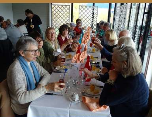
Repas du 11 novembre