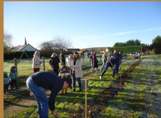
1 naissance 1 arbre