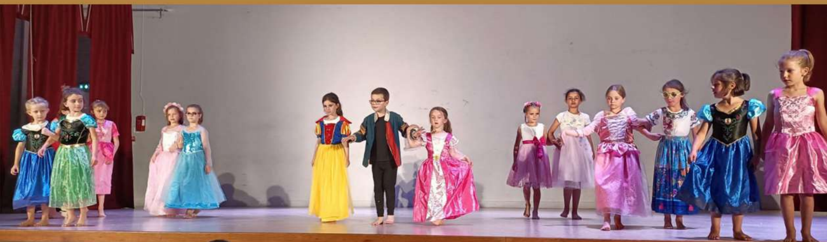
Spectacle de danse